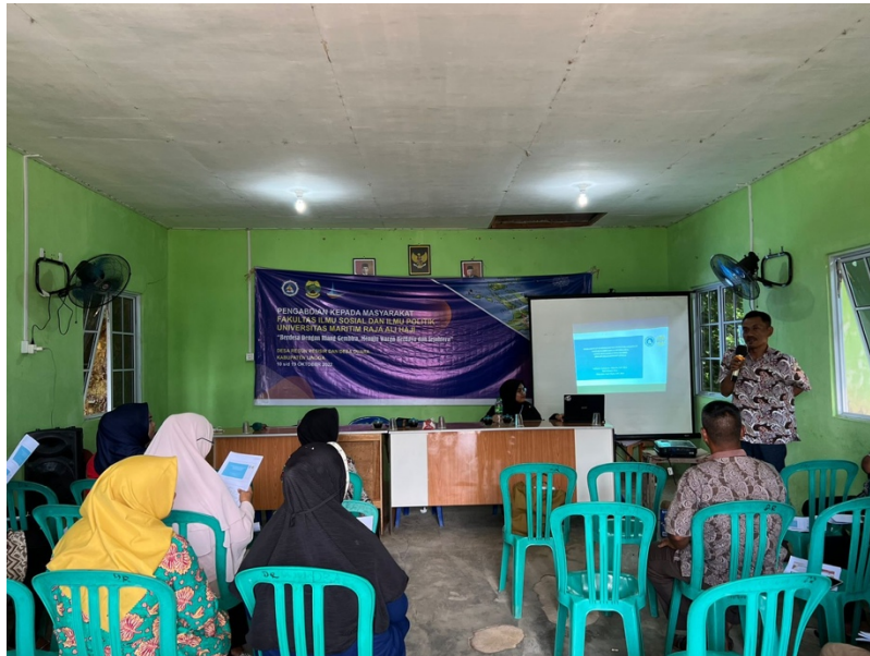
Gambar 1. Penyampaian Materi terkait Potensi Sumber Daya Alam Desa

Demi tercapainya target kegiatan PKM terhadap kelompok sasaran kami, maka diperlukan keterwakilan kelompok sasaran yaitu Pemerintah Desa, Pengurus BUMDes dan Tokoh Masyarakat. Maka pemaparan materi dan pendampingan terkait pemetaan potensi Desa hanya untuk kelompok sasaran, juga diikuti oleh Pemuda Desa Duara. Kegiatan diawali dengan pemaparan materi dari Tim Pengabdian mengenai potensi Desa, dengan cuplikan materi pengabdian adalah sebagai berikut: