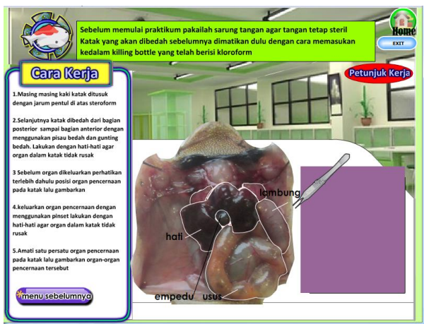
Gambar 3. Kegiatan praktikum pembedahan katak yang dilengkapi dengan cara kerja.

sampai lab 5, tombol lab tersebut merupakan tombol untuk masing-masing praktikum yang akan dilakukan. Pada tampilan slide aktivitas terdapat tombol home disudut kanan atas yang beranimasikan rumah, terdapat tombol navigasi (Tujuan, Materi, Video, Virtual Lab , dan Daftar rujukan), terdapat gambar organ-organ dalam pada sudut kiri bawah dan pada tampilan slide terdapat beberapa kombinasi warna.