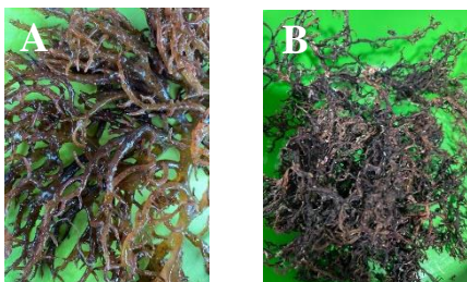
Gambar 1. Rumput laut merah E. cottonii segar (A); kering (B)

Rumput laut E. cottonii umumnya hidup di daerah pantai yang banyak terumbu karang ( reef ). Habitat rumput laut Eucheuma sp. di perairan jernih yang memiliki substrat dasar batu karang. Eucheuma sp. tumbuh di perairan yang memiliki arus dan ombak yang besar. Rumput laut ini tersebar secara luas di perairan dunia. Bentangan tumbuhan Eucheuma sp. yang padat dan luas juga merupakan habitat untuk berbagai jenis biota laut lainnya, yaitu kerang dan ikan. Eucheuma sp. tumbuh di bentangan perairan pantai di zona paparan terumbu ( reef flats ) mulai dari garis pantai sampai ujung tubir termasuk dalam perairan intertidal dan subtidal (Kramandondo et al., 2022). Rumput laut E. cottonii terdeteksi senyawa aktif alkaloid, steroid, flavonoid, saponin, fenol hidrokuinon, dan tannin. Rumput laut E. cottonii memiliki kadar protein sebesar 4,16±0,61%, lemak sebesar 0,36±0,23%, karbohidrat sebesar 25,50±6,06%, kadar air 23,22±16,4%, kadar abu sebesar 43,49±9,23% dan serat kasar 2,82±0,77% (Safia et al., 2020). Kenampakan rumput laut E. cottonii dapat dilihat pada Gambar 1.