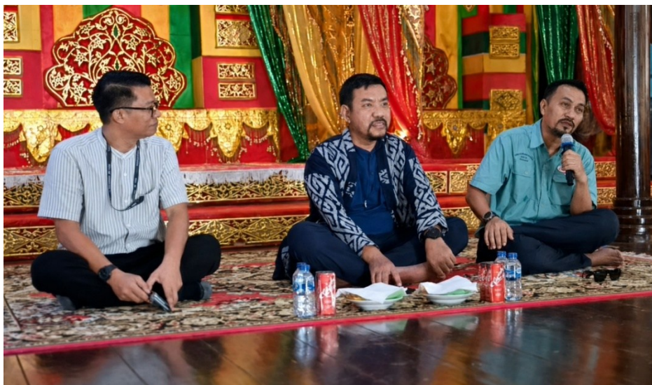
Gambar 2. Pematiri dalam Kegiatan PKM

Kondisi Pulau Penyengat sebagai kawasan wisata budaya juga memperlihatkan adanya tantangan dalam menjaga keseimbangan antara pengembangan pariwisata dan perlindungan nilai sejarah. Aktivitas wisata dapat memberikan manfaat ekonomi bagi masyarakat, terutama melalui jasa transportasi, kuliner, pemandu lokal, dan kegiatan ekonomi kreatif. Namun, apabila pengembangan wisata tidak disertai pemahaman pelestarian, maka kawasan heritage berisiko mengalami penurunan makna karena lebih ditekankan sebagai ruang konsumsi wisata dibandingkan sebagai ruang kebudayaan.