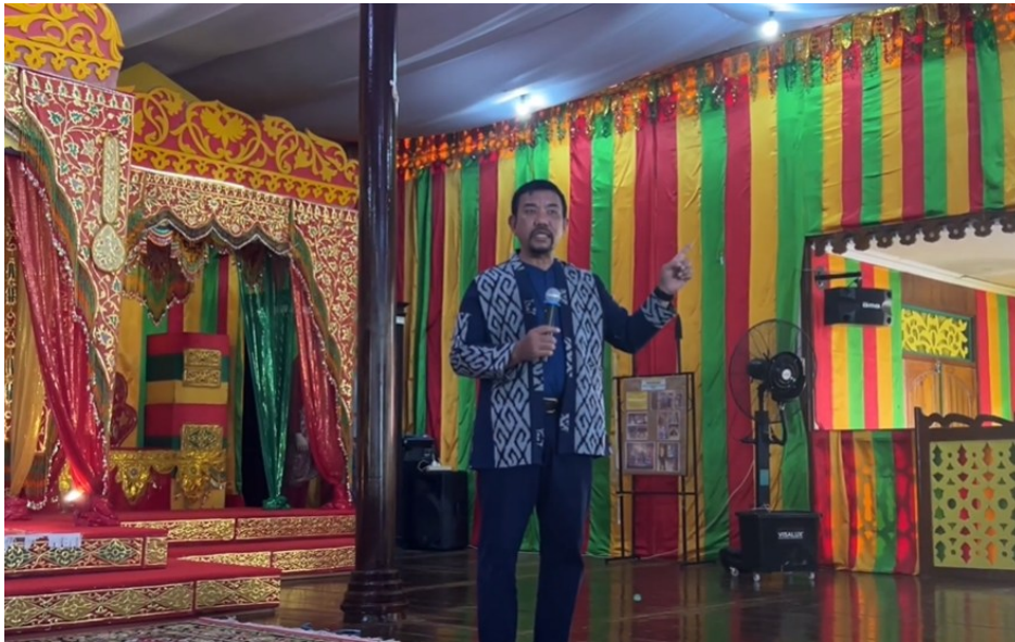
Gambar 3. Penyampaian dalam Kegiatan PKM kepada Mahasiswa dan Masyarakat

Penyengat memiliki nilai strategis tidak hanya sebagai objek wisata, tetapi juga sebagai pusat narasi sejarah Melayu yang dapat memperkuat citra pariwisata Kepulauan Riau. Penjelasan tersebut membantu peserta memahami bahwa pembangunan pariwisata tidak boleh hanya berorientasi pada jumlah kunjungan, tetapi juga harus mempertimbangkan keberlanjutan situs, kenyamanan masyarakat lokal, dan perlindungan nilai budaya yang menjadi identitas kawasan.