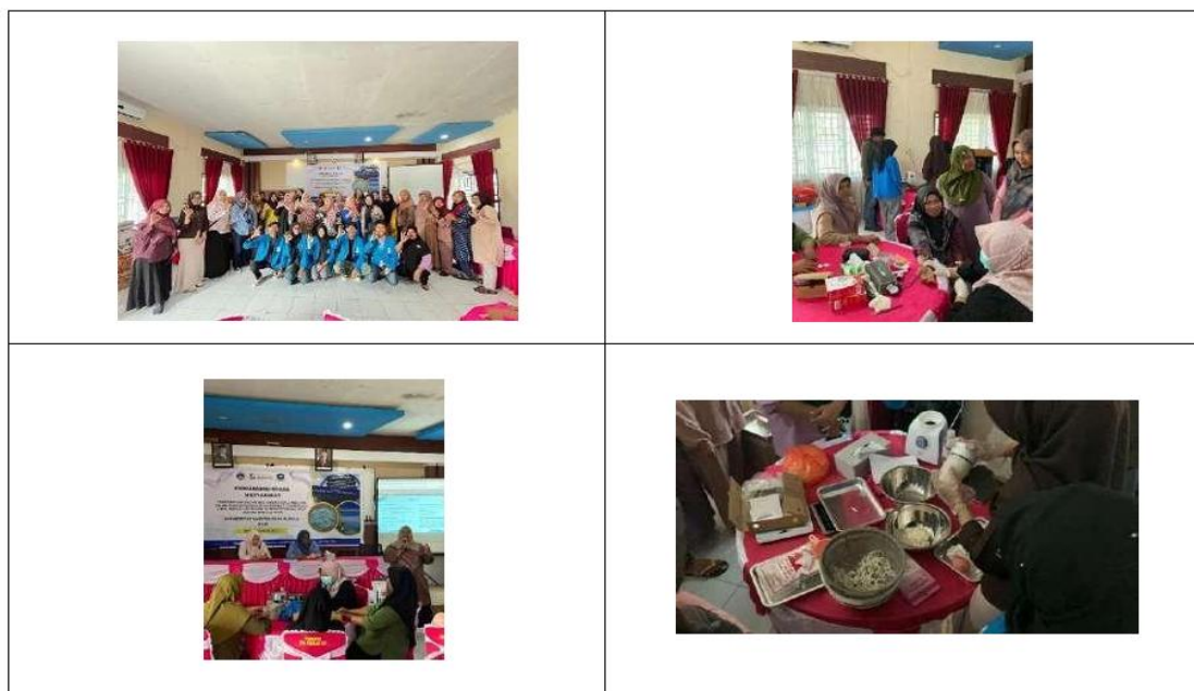
Gambar 2. Sosialisasi Pembuatan dan Manfaat Beras Analog kepada Masyarakat Desa Pengujan

Pada pertanyaan kedua, terkait manfaat utama beras analog rumput laut-sagu bagi penderita diabetes, rata-rata jawaban benar meningkat dari 22,7% menjadi 100% dengan perubahan sebesar +77,3%. Hal ini