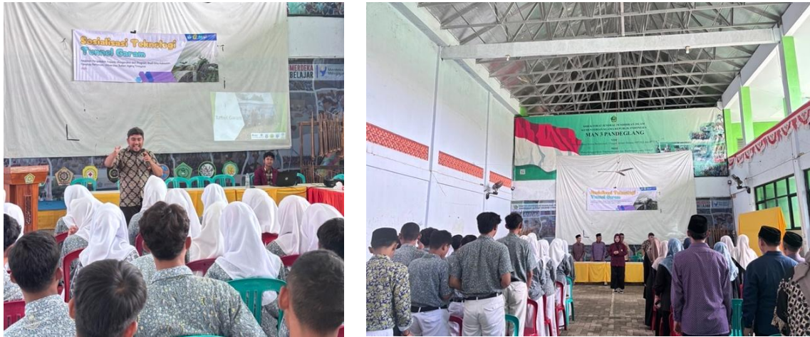
Gambar 3. Kegiatan Sosialisasi Tunnel Garam di MAN 3 Pandeglang