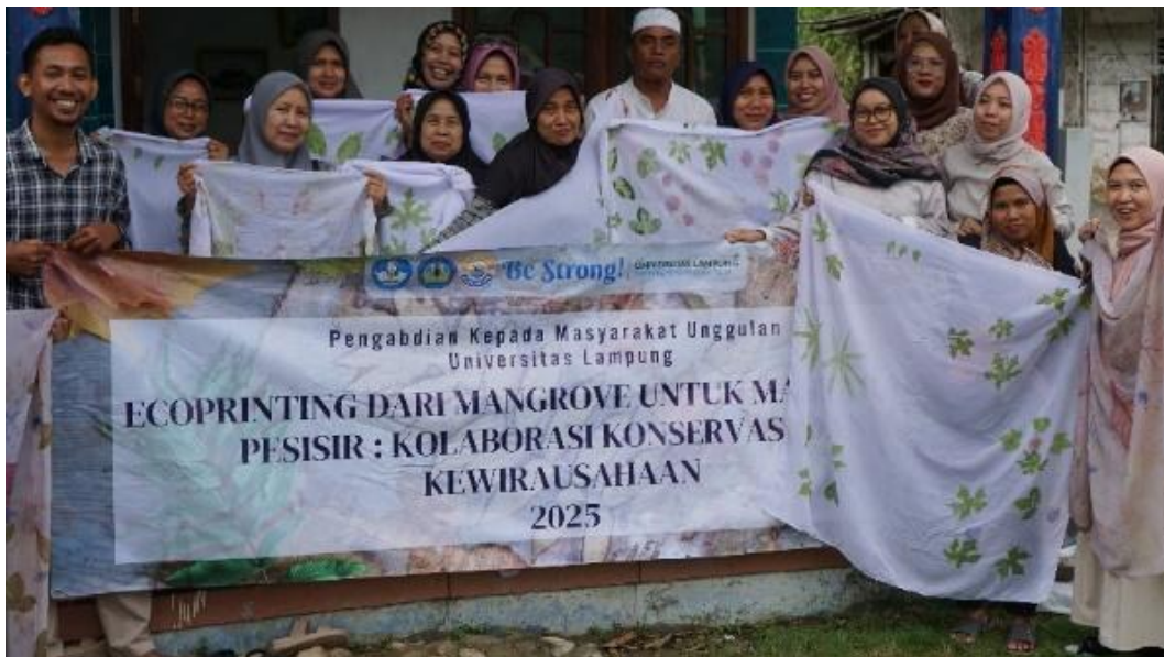
Gambar 2. Hasil Ecoprinting Peserta Pelatihan

Hasil evaluasi menunjukkan peningkatan nilai rata-rata peserta dari 81 ( pre-test ) menjadi 100 ( post-test ) atau naik 19%, menandakan pelatihan ecoprint efektif meningkatkan keterampilan dan peserta peserta (Gambar 3). Setelah mengikuti pelatihan yang mencakup teknik mordanting, penataan daun, pounding , dan fiksasi warna, peserta mampu menerapkan proses ecoprint dengan benar. Metode pelatihan yang