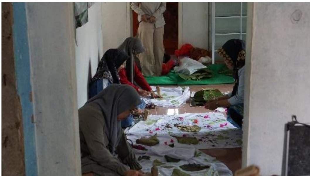
Gambar 1. Proses Pencetakan Ecoprint

Fiksasi adalah proses untuk mengunci warna (pigmen daun) pada serat kain agar hasil ecoprint tidak mudah luntur, lebih tahan lama, dan warnanya lebih tajam. Proses ini diawali dengan menyiapkan larutan fiksasi yang biasanya menggunakan bahan alami seperti tawas, tunjung, atau kapur. Tawas berfungsi memberikan hasil warna yang lebih cerah, tunjung cenderung menggelapkan warna hingga abu-abu atau hitam kehijauan, sedangkan kapur mampu memperkuat warna kuning atau hijau. Kain hasil ecoprint yang telah selesai melalui proses pounding atau steaming kemudian direndam ke dalam larutan fiksasi selama kurang lebih 15–30 menit, sambil sesekali diaduk perlahan agar larutan meresap secara merata. Setelah proses perendaman, kain dibilas dengan air bersih