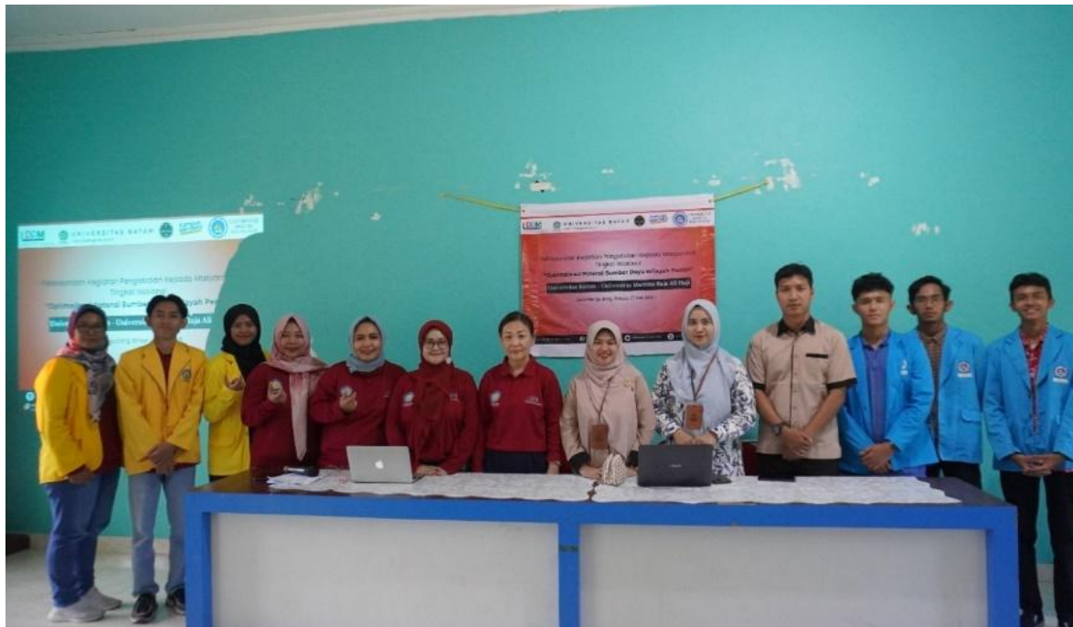
Gambar 2. Sosialisasi Hak Kekayaan Intelektual (HAKI)

(HAKI) di Desa Pengudang telah berhasil membangun kesadaran awal masyarakat pesisir mengenai pentingnya perlindungan karya, budaya, dan potensi lokal melalui mekanisme hukum yang sah. Hasil evaluasi menunjukkan bahwa meskipun pemahaman awal peserta terhadap Hak Kekayaan Intelektual (HAKI) masih tergolong rendah, mayoritas mengakui relevansi Hak Kekayaan Intelektual (HAKI) dalam pengembangan destinasi wisata daerah. Tingkat partisipasi yang tinggi menunjukkan antusiasme masyarakat terhadap topik ini, sementara beragamnya tingkat kesiapan penerapan mencerminkan adanya peluang sekaligus tantangan dalam implementasinya. Kegiatan ini tidak hanya menjadi sarana edukasi, tetapi juga memicu inisiatif untuk melanjutkan proses perlindungan kekayaan intelektual secara berkelanjutan melalui pelatihan lanjutan dan pendampingan teknis. Dengan dukungan yang tepat dari berbagai pihak, program ini berpotensi menjadi model pemberdayaan masyarakat berbasis perlindungan kekayaan intelektual di wilayah pesisir, yang pada akhirnya dapat meningkatkan daya saing ekonomi