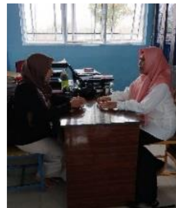
Gambar 1. Konsultasi dengan Pihak Sekolah