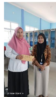
Gambar 2. Distribusi Surat Izin Pelaksanaan Kegiatan PkM di Sekolah