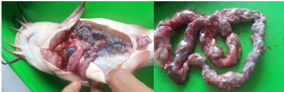
Gambar 4. Saluran Pencernaan Ikan Sembilang