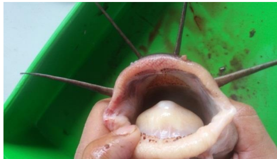
Gambar 7. Bentuk mulut dan gigi ikan Sembilang di Teluk Pengujan

Karakter makan ikan sembilang dilihat dari jenis makanan termasuk karnivora karena lebih dominan jenis makanannya adalah hewani. Tetapi dari panjang usus ikan sembilang tidak termasuk karnivora karena tidak memiliki usus yang lebih pendek dari panjang tubuhnya. Menurut Lagler et al. (1977) dan Serajuddin et al. (1998), menyebutkan bahwa ikan yang memiliki alat pencernaan lebih pendek dari panjang total tubuh merupakan salah satu ciri ikan karnivora. Maka bisa disimpulkan ikan sembilang bersivat omnivora dimana terdapat lumpur di dalam usus ikan sembilang serta bentuk mulut khususnya gigi tidak runcing dan tajam. Gambar mulut dan bentuk gigi dapat dilihat pada gambar 7 dibawah ini: