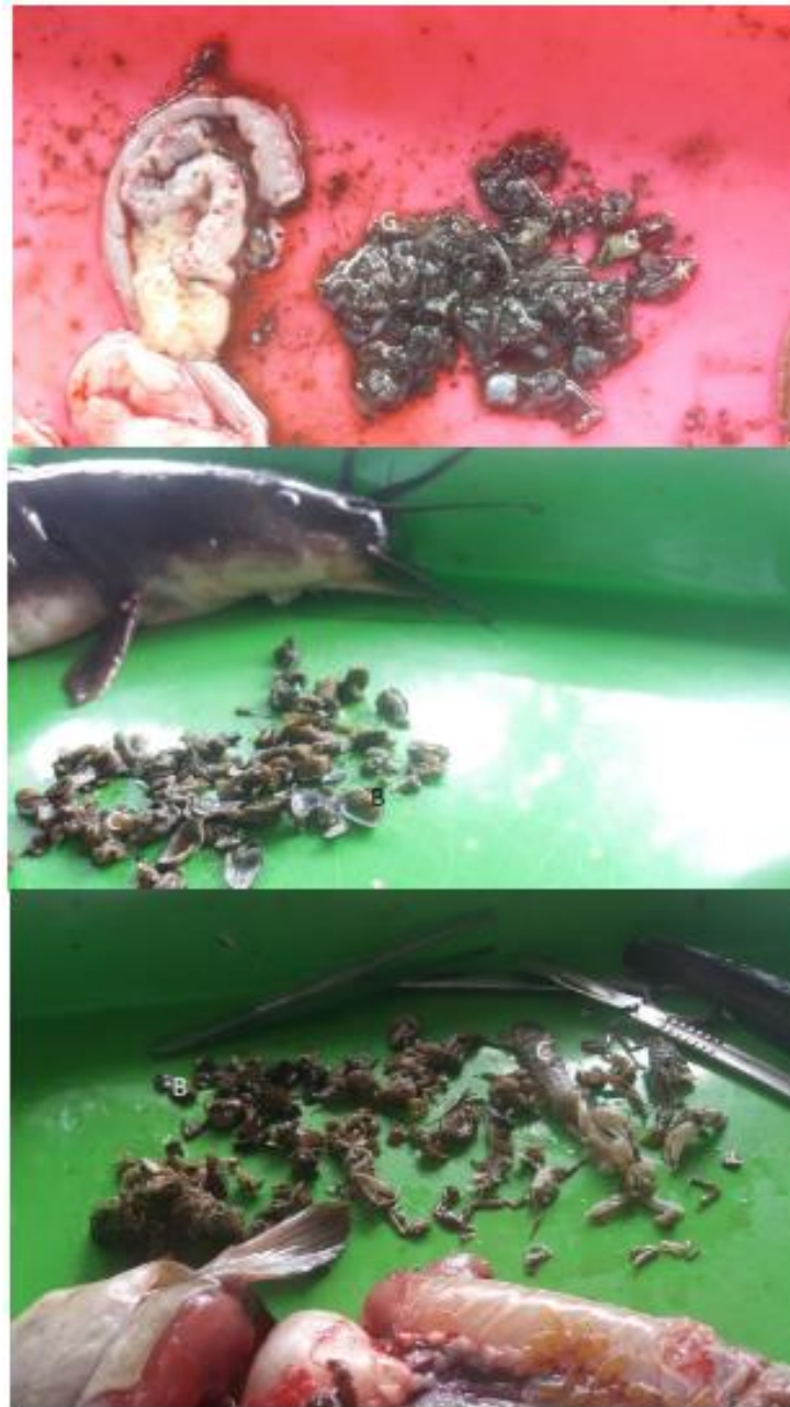
Gambar 5. Tampilan Jenis pakan alami ikan sembilang di Teluk Pengujan.