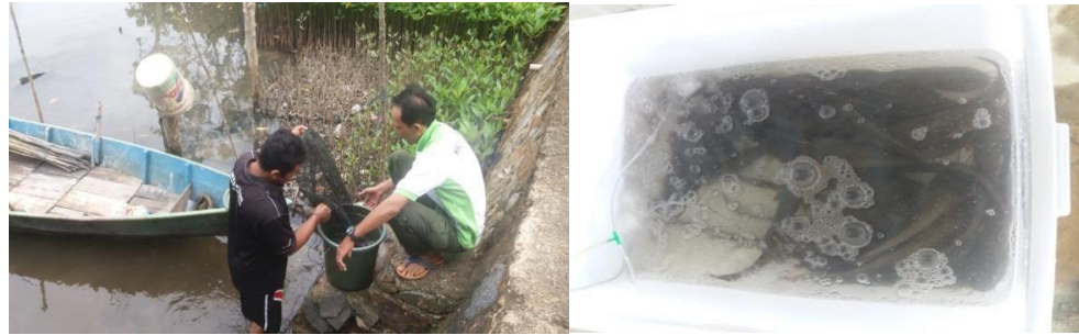
Gambar 1. Pengambilan sampel ikan sembilang dari penangkap