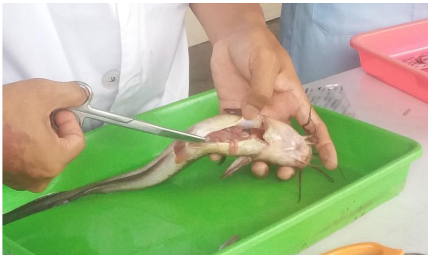
Gambar 2. Pembedahan ikan sembilang

Pembedahan ikan sembilang dimulai dengan menyiapkan ikan sembilang sebanyak 35 ekor. Ikan yang tersedia akan dipotong patil dada dan punggung karena mengandung racun. Ikan sembilang yang telah dipotong patilnya akan dibius menggunakan minyak cengkeh sebanyak 0,5 ml untuk 25 liter air. Ikan direndam selama 5 menit, kemudian akan dilakukan pembedahan menggunakan alat bedah dengan metode pembedahan huruf Y.