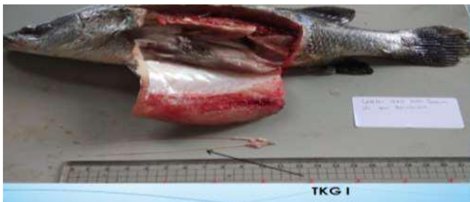
Gambar 1. Gonad jantan ikan Kakap putih TKG I ( L. calcarifer Block) keterangan: seperti benang pada seluruh bagian gonadnya. Gonad jantan tingkat I memiliki ukuran sangat kecil, pipih dan berwarna kelabu sehingga perlu ketelitian tinggi untuk dapat melihatnya.

Tabel 3 menunjukkan tingkat kematangan gonad pada akhir penelitian. Dapat dilihat bahwa perlakuan Optimal pemberian adalah 60 IU penyuntikan dosis Oodev dengan pencapaian TKG III dari keseluruhan sampel. Perlakuan 20 IU, 40 IU sebagian masih dalam TKG II. Perlakuan NaCl (kontrol) dari keseluruhan sampel masih dalam TKG I. Gonad jantan ikan Kakap putih ( L. calcarifer Block) tidak jauh berbeda dengan gonad ikan jantan pada umumnya. Untuk gambaran TKG dapat dilihat Pada Gambar 1,2,dan 3 di bawah ini .