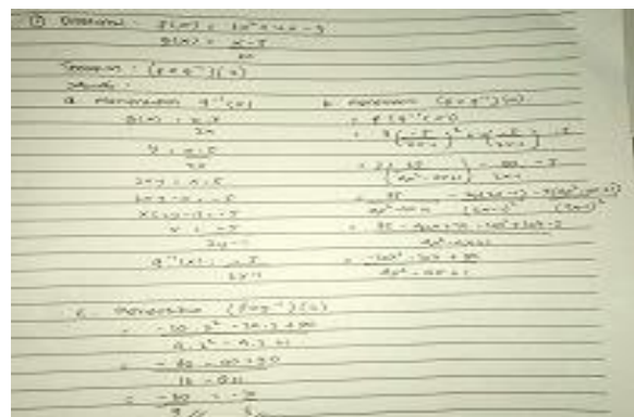
Gambar 3. Hasil penyelesaian soal fungsi dari mahasiswa dengan kemampuan komunikasi tinggi

Gambar 3 menunjukkan contoh mahasiswa yang memiliki komunikasi matematika tinggi. Mahasiswa yang bisa menjawab dengan cara ini akan dikelompokkan ke dalam kelompok mahasiswa dengan kemampuan komunikasi tinggi.