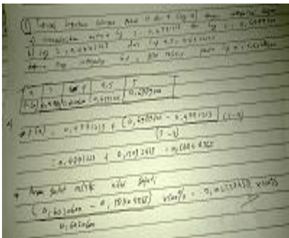
Gambar 2. Hasil penyelesaian soal metode numerik dari mahasiswa dengan kemampuan komunikasi kurang baik

Dari kedua gambar diatas dapat dibandingkan bagaimana perbedaan antara mahasiswa dengan kemampuan komunikasi matematika yang baik dan yang kurang baik. Hal ini mungkin terjadi karena karakteristik setiap mahasiswa memang berbeda.