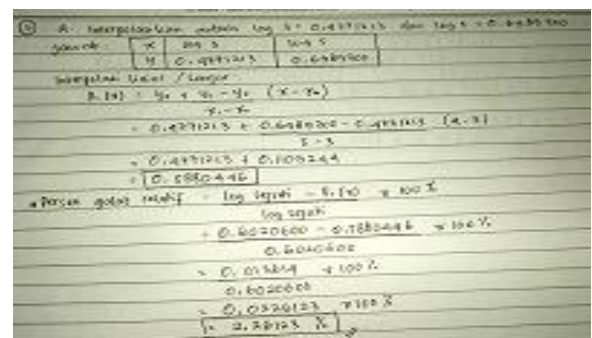
Gambar 1. Hasil penyelesaian soal metode numerik dari mahasiswa dengan kemampuan komunikasi cukup baik

Gambar 1 menunjukkan salah satu contoh hasil pengerjaan soal yang dikerjakan mahasiswa dengan kemampuan komunikasi matematika yang cukup baik. Dari gambar 1 terlihat bagaimana mahasiswa tersebut secara sistematis menyelesaikan soal metode numerik yang diminta kemudian menganalisis soal, menulis rumus yang diminta dan mengerjakan dengan tahapan-tahapan yang sesuai.