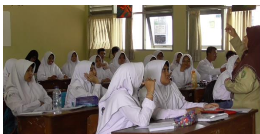
Gambar 2. Guru Membimbing Siswa untuk Membantu Menemukan Konsep

Guru membimbing siswa melalui ilustrasi peristiwa yang ada di kehidupan sehari-hari. Salah satu ilustrasinya dalam bentuk cerita perkebangbiakan ayam agar siswa lebih dapat memahami, seperti tampak pada Gambar 2.