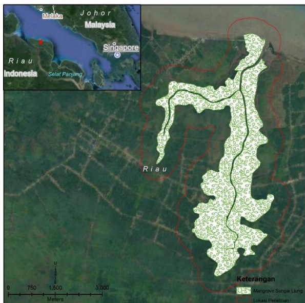
Gb. 1 Peta lokasi penelitian, ekosistem mangrove Sungai Liong Pulau Bengkulu

Penelitian ini menggunakan metode survei dengan pendekatan analisis deskriptif. Data primer dikumpulkan melalui observasi dan wawancara mendalam. Menurut Bungin (2011), analisis deskriptif bertujuan untuk menjelaskan berbagai kondisi, situasi atau berbagai variabel yang timbul dari objek penelitian berdasarkan apa yang terjadi. Dalam penelitian ini digambarkan lingkup pemanfaatan kayu mangrove oleh masyarakat Suku Asli, jenis, ukuran dan harga kayu mangrove, jumlah kayu yang dikumpulkan berdasarkan kategori dan sarana dan prasarana yang digunakan masyarakat dalam mengumpulkan kayu mangrove.