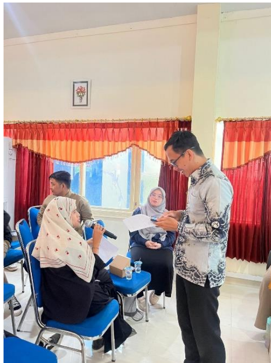
Gambar 4. Salah seorang mahasiswa menyampaikan hasil analisis kelompok

Langkah ketiga, setelah selesai menganalisis teks mentor, mahasiswa mempresentasikan hasil kerja kelompok mereka secara bergantian. Gambar 4 menunjukkan seorang mahasiswa mempresentasikan hasil analisis mereka terhadap salah satu penulis.