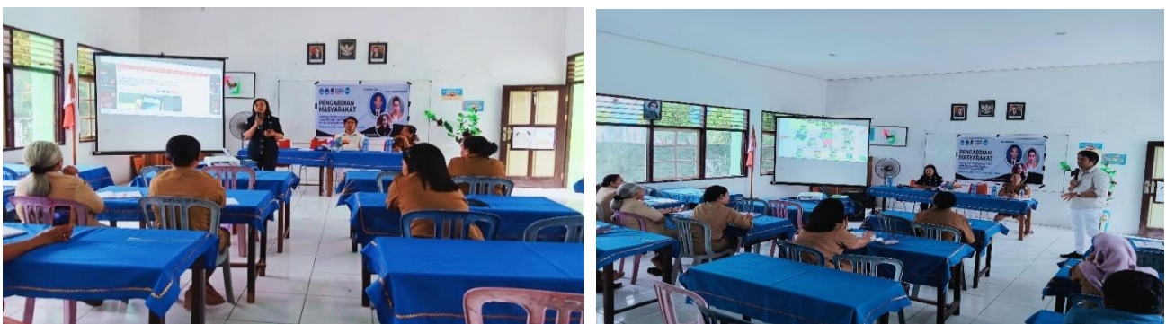
Gambar 1. Pemaparan materi dan diskusi

Sebelum mengikuti sosialisasi tentang perundungan, para guru di SD Negeri Inpres 4 Dobo umumnya memiliki pemahaman yang terbatas tentang bentuk, dampak, dan penanganan perundungan di lingkungan sekolah. Beberapa guru menganggap perundungan sebagai perilaku yang sulit dihindari di kalangan siswa, sementara sebagian lainnya belum sepenuhnya memahami dampak jangka panjangnya terhadap kesehatan mental dan emosional siswa.