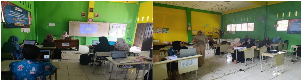
Gambar 3. Suasana kegiatan bimtek

Rancangan modul pembelajaran yang telah didesain para guru SDI Ats-Tsiqoh Palangka Raya selanjutnya dikembangkan ( develop ) dengan bantuan program Canva. Canva, sebagai alat desain grafis yang user-friendly , memungkinkan guru untuk menciptakan template modul yang lebih menarik secara visual (Hutabarat et al., 2022; Nurjati et al., 2024). Sajian modul yang menarik dapat meningkatkan antusiasme siswa untuk belajar, oleh karena itu ini sangatlah penting (Handayani et al., 2022; Ningtyas et al., 2020). Para guru diajarkan cara menggunakan fitur-fitur Canva untuk merancang template modul yang tidak hanya atraktif dan informatif tetapi juga mudah dipahami oleh siswa. Pada Gambar 4 berikut disajikan beberapa hasil template sampul depan modul yang telah mampu dikembangkan oleh beberapa peserta bimtek.