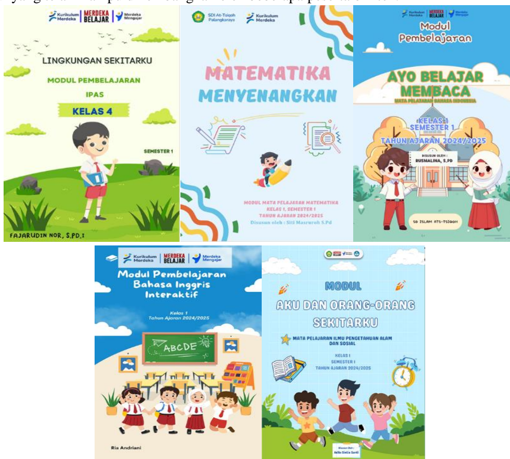
Gambar 4. Beberapa modul pembelajaran yang dirancang

Rancangan modul pembelajaran yang telah didesain para guru SDI Ats-Tsiqoh Palangka Raya selanjutnya dikembangkan ( develop ) dengan bantuan program Canva. Canva, sebagai alat desain grafis yang user-friendly , memungkinkan guru untuk menciptakan template modul yang lebih menarik secara visual (Hutabarat et al., 2022; Nurjati et al., 2024). Sajian modul yang menarik dapat meningkatkan antusiasme siswa untuk belajar, oleh karena itu ini sangatlah penting (Handayani et al., 2022; Ningtyas et al., 2020). Para guru diajarkan cara menggunakan fitur-fitur Canva untuk merancang template modul yang tidak hanya atraktif dan informatif tetapi juga mudah dipahami oleh siswa. Pada Gambar 4 berikut disajikan beberapa hasil template sampul depan modul yang telah mampu dikembangkan oleh beberapa peserta bimtek.