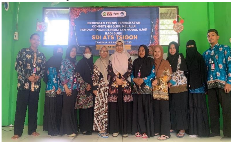
Gambar 1. Pelaksana PkM dan para guru SDI Ats-Tsiqoh Palangka Raya

Bentuk kegiatan pada Pengabdian kepada Masyarakat (PkM) ini adalah bimbingan teknis (bimtek) terkait penyusunan modul pembelajaran yang diikuti oleh 10 orang guru dari SDI Ats-Tsiqoh Palangka Raya sebagai peserta. Bimtek merupakan kegiatan pelatihan yang bertujuan untuk meningkatkan kemampuan teknis, pengetahuan, dan keterampilan peserta dalam bidang tertentu sehingga dalam penerapannya para peserta dapat meningkatkan kualitas kerja (Lessy, 2022). Kegiatan PkM ini melibatkan guru-guru di SDI Ats-Tsiqoh Palangka Raya. Dalam hal ini, bimtek dilakukan untuk meningkatkan kompetensi profesional para peserta melalui pembuatan modul pembelajaran. Pelaksanaan bimtek berupa paparan presentasi, demonstrasi, tanya jawab dan konsultasi/pembimbingan yang berlangsung selama selama 3 hari, bertempat di SDI Ats-Tsiqoh Palangka Raya Provinsi Kalimantan Tengah.