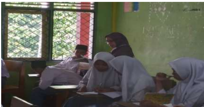
Gambar 4. Siswa sedang melaksanakan praktik note-taking

Materi pada hari kedua PkM adalah strategi note-taking ketika mendengar penjelasan dari guru. Materi dan latihan diberikan secara simultan agar siswa langsung bisa mempraktikkan pengetahuan yang baru mereka terima. Secara umum, teknis melakukan note-taking ketika mendengar sama dengan note-taking ketika membaca. Namun karena kepekaan siswa berbeda-beda, hasil catatan mereka pun jadi berbeda pula.