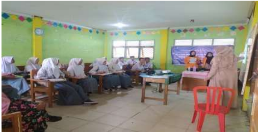
Gambar 3. Tim PkM memberikan materi tentang note-taking

masih anak-anak dan mereka masih malu-malu, tidak ada pertanyaan dari awal kegiatan hingga masuk ke materi kedua, bahkan hingga akhir kegiatan PkM. Namun, mereka aktif merespon pertanyaan-pertanyaan dari pemateri PkM. Yang siswa tanyakan kebanyakan pada bagaimana cara mendownload aplikasi, bagaimana proses registrasi pada aplikasi tersebut, dan hal teknis lainnya. Antusiasme mereka mengikuti rangkaian pelatihan patut diapresiasi.