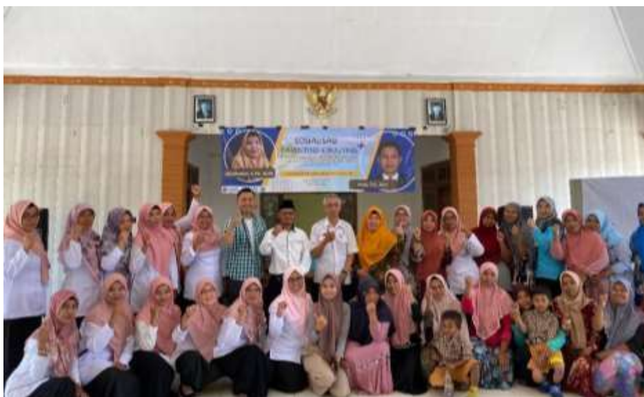
Gambar 2. Foto pemateri dan peserta setelah kegiatan sosialisasi berakhir

Setelah melakukan evaluasi dan dinyatakan sosialisasi telah selesai, pemateri dan peserta melakukan foto bersama yang dapat dilihat pada Gambar 2.