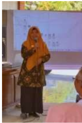
Gambar 1. Penyampaian sosialisasi mengenai pola asuh orang tua terhadap perkembangan emosi anak