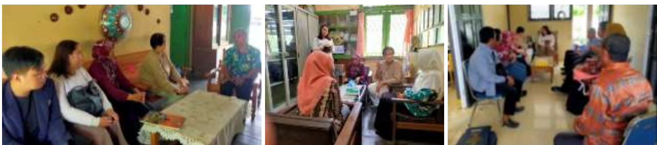
Gambar 1. Wawancara dengan pendidik IPA di SMP Entikong

Tahap persiapan dalam kegiatan PKM ini dilakukan persiapan administrasi guna menunjang kelancaran pada kegiatan pendampingan meliputi materi mengenai modul ajar, desain spanduk, serta pembuatan kuesioner respons pendidik. Pada tahap ini juga dilakukannya wawancara kepada beberapa pendidik IPA di Entikong mengenai penggunaan modul ajar berbasis Kurikulum Merdeka. Hasil wawancara diketahui bahwa pendidik IPA di Entikong memahami konsep dasar Kurikulum Merdeka karena sebelumnya sudah ada yang mengikuti program in house training , akan tetapi dalam praktik pembuatan modul ajar masih terkendala dan kebingungan dalam mengintegrasikan model pembelajaran proyek. Pada praktik pembelajaran di kelas, pendidik masih menerapkan metode ceramah dan diskusi biasa tanpa adanya penugasan proyek bagi peserta didik. Hal tersebut sesuai dengan hasil temuan Laia et al., (2024) di mana pendidik dalam mengaplikasikan model pembelajaran inovatif dan variatif terkhusus proyek belum terlaksana secara maksimal sehingga mengakibatkan rendahnya hasil belajar peserta didik karena merasa kesulitan dalam pemecahan masalah di lingkungan sekitarnya.