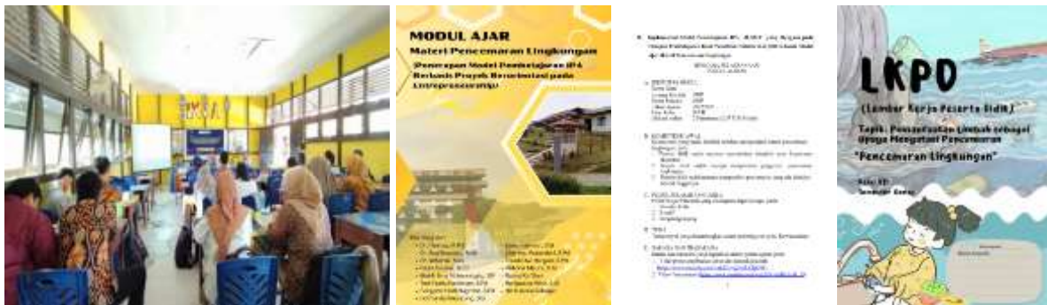
Gambar 2. Kegiatan pendampingan fase plan dan modul ajar yang dihasilkan

Berdasarkan Gambar 2 hasil tahap kegiatan fase plan diketahui bahwa pendidik sudah dapat mengembangkan modul ajar materi pencemaran lingkungan yang berbasis proyek dengan berorientasi entrepreneurship untuk penguatan Profil Pelajar Pancasila secara baik dan sistematis. Hal tersebut dibuktikan dengan tersedianya komponen modul, perumusan capaian pembelajaran dan alur tujuan pembelajaran yang sudah baik, perumusan tujuan pembelajaran yang mempertimbangkan karakteristik peserta didiknya, pemilihan materi ajar yang sesuai dengan keadaan lingkungan sekitar. Pada perkembangan kurikulum sekarang, dalam mengimplementasikan pembelajaran IPA menggunakan fase-fase model pembelajaran berbasis proyek harus menyesuaikan dengan karakteristik kurikulum merdeka dengan memperhatikan potensi atau permasalahan yang terdapat di lingkungan sekitar peserta didik (Jauhariyah et al., 2023; Putra et al., 2024; Rahayu et al., 2024). Media pembelajaran yang dirancang untuk mengoptimalkan sarana dan prasarana yang ada di sekolah, serta rancangan penilaian yang lengkap terdiri dari LKPD, asesmen diagnostik, asesmen kognitif, afektif dan psikomotorik. Dalam kegiatan fase plan , pendidik memiliki kendala dalam merancang