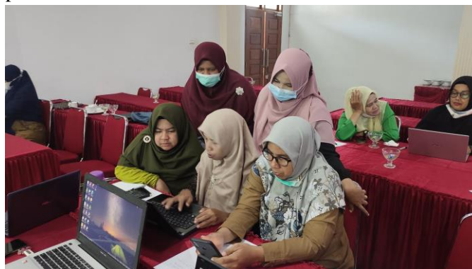
Gambar 2. Peserta Berdiskusi Dengan Rekan Sejawat

Sebelum menuliskan cerita praktik baik, peserta terlebih dahulu menyimak penjelasan cara pengisian umpan balik. Lembar umpan balik digunakan untuk mengamati simulasi cerita praktik baik dari anggota kelompok lain. Setiap peserta diberi kesempatan waktu untuk bercerita selama 7 menit sesuai dengan cerita yang telah disusun. Kelompok lain diberikan kesempatan untuk memberikan umpan balik terhadap kemampuan dan strategi bercerita peserta. Selain itu, peserta memberikan apresiasi terhadap penampilan peserta. Pada tahap ini diakhiri dengan pemberian penguatan kepada peserta. Diharapkan kepada peserta untuk dapat menjadikan cerita praktik baik menjadi sumber belajar yang dapat diakses oleh guru yang belum mengikuti pelatihan ini. Peserta membahas hasil simulasi dan mengajukan pertanyaan tentang perasaan peserta ketika mendengar peserta lain bercerita.