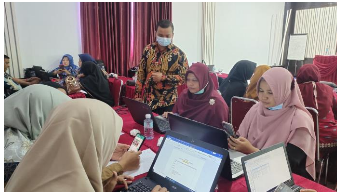
Gambar 1. Peserta Menyusun Cerita Praktik Baik Secara Berkelompok

Selanjutnya peserta difasilitasi untuk mengulas kembali pembelajaran mandiri terbimbing dan menggali pertanyaan berdasarkan pengalaman serta menjelaskan praktik baik dan strategi menyusun cerita praktik baik. Tahapan selanjutnya adalah menjelaskan tentang konsep dan ruang lingkup praktik baik. Peserta terlibat dalam penyusunan kerangka cerita dengan format STAR (Situasi- Tantangan- Aksi- Refleksi. Kemudian peserta diajak untuk berbagi hasil pemahaman praktik baik melalui cerita. Kemudian peserta melanjutkan kegiatan berbagi pemahaman tentang praktik baik. Capaian yang diharapkan pada tahap ini adalah peserta dapat menyusun cerita praktik baik pembelajaran berbasis kurikulum merdeka. Untuk mencapai tujuan tersebut, peserta diberikan kesempatan untuk memahami kembali lembar kerja penulisan cerita praktik baik secara berkelompok. Selanjutnya peserta menuliskan poin-poin penting yang berkaitan dengan penerapan pembelajaran berbasis kurikulum merdeka.