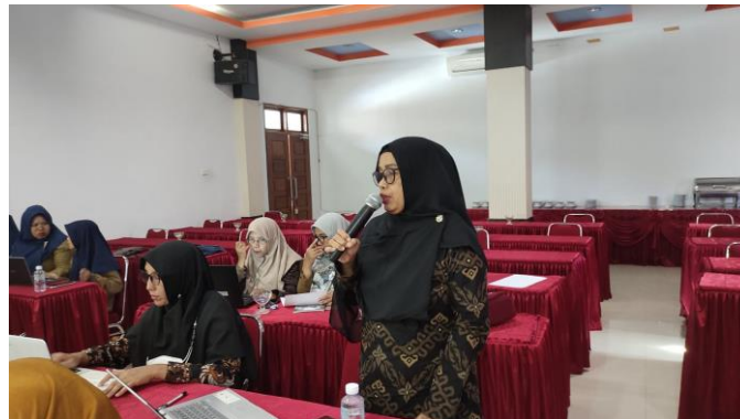
Gambar 3. Peserta Praktik Bercerita Praktik Baik

telah dipelajari. Tahapan selanjutnya peserta menyusun rencana tindak lanjut bercerita praktik baik atau tindak lanjut yang ingin dilakukan setelah kegiatan berlangsung. Pada tahap terakhir mengapresiasi hasil kerja setiap peserta terkait praktik baik yang telah disusun dan ditutup dengan membagikan lembar refleksi kepada semua peserta.