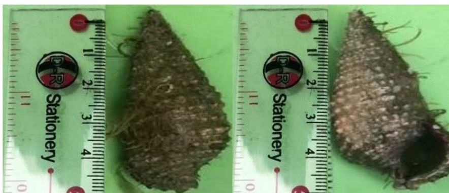
Gambar 4. Morfologi B. multiformis

Jenis B. multiformis ditemukan di Perairan Air Kelubi. Adapun bentuk dari jenis B. multiformis dapat dilihat pada Gambar 4.