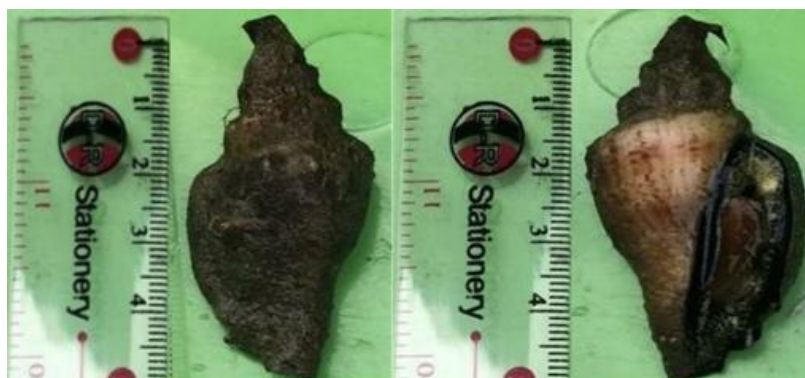
Gambar 6. Morfologi S. urceus

Jenis S. urceus ini salah satu dari jenis siput gonggong yang ditemukan di Perairan Pesisir Air Kelubi, Adapun bentuk dari jenis S. urceus dapat di lihat pada Gambar 6.