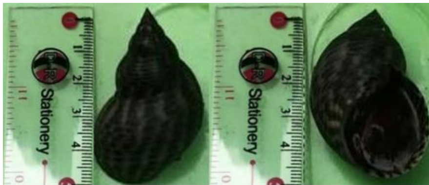
Gambar 5. Morfologi L. scabra

Jenis L. scabra ditemukan di Perairan Air Kelubi. Adapun bentuk dari jenis L. Scabra dapat dilihat pada Gambar 5.