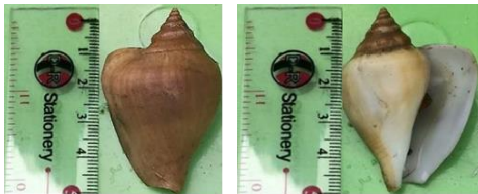
Gambar 2. Morfologi S turturella .

Jenis S. turturella merupakan salah satu jenis yang sering dijumpai di Air Kelubi Desa Resun Pesisir. Siput ini banyak ditemukan di substrat lumpur berpasir. Adapun bentuk dari jenis S. turturella dapat dilihat pada Gambar 2.