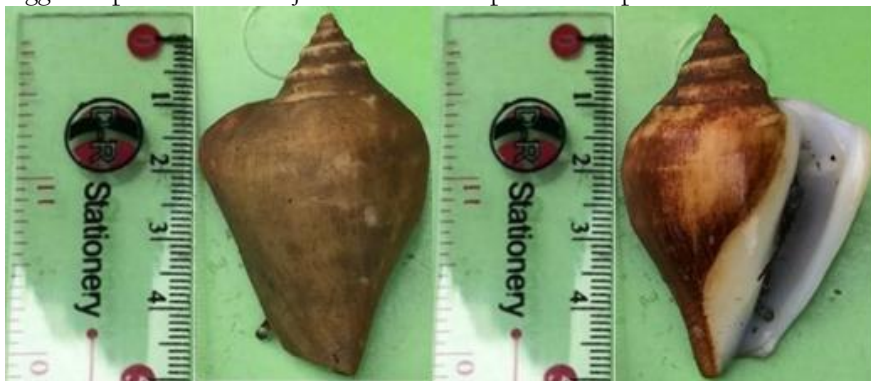
Gambar 3. Morfologi S. canarium

Jenis S. canarium merupakan salah satu dari jenis siput gonggong yang ditemukan di Perairan Pesisir Air Kelubi. Dan jenis siput gonggong ini menjadi jenis yang paling utama untuk diperjualkan ke Restoran ataupun luar daerah, dikarenakan bentuk cangkangnya yang tebal, dan dagingnya yang enak dimakan, membuat harga jual siput gonggong ini pun tinggi. Adapun bentuk dari jenis S. canarium dapat dilihat pada Gambar 3.